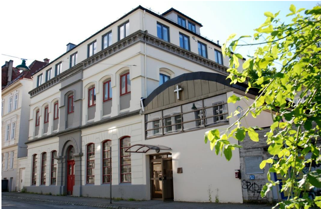
DELK-kirken i Rosenberggaten 1, Bergen (tidligere Salem)

Vi er takknemlige for å kunne presentere en talerliste bestående av tre menn som alle kjennetegnes ved en klar bekjennelse og dyp innsikt i Skriften, og som sammen besitter svært bred pastoral erfaring og kunnskap om den situasjon vi i dag står i som lutheranere. Vi ser med stor glede frem til disse dagene, og vil frimodig be dere om allerede nå å sette av denne helgen, slik at vi kan møtes i Bergen i slutten av august 2014, til oppbyggelse, oppmuntring og fornyelse.